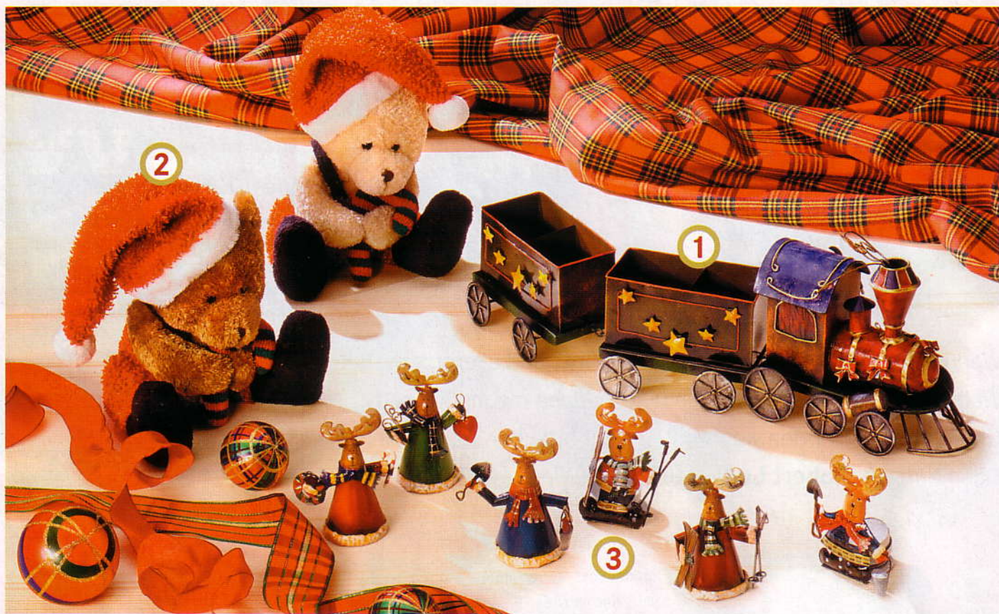
① Dampflokomotive mit Wagons. Aus Metall aufwändig gearbeiteter, nostalgischer Zug. € 24,50 ② Bär Polly. Teddybär aus kuscheligem Material mit roter Zipfelmütze. € 2,- ③ Elche. Mit oder ohne Teelichthalterung bringen diese Elche vorweihnachtliche Stimmung in jedes Haus. Ab € 2,20

» sich ideal einsetzen, um den Weihnachtszauber zu beschwören.